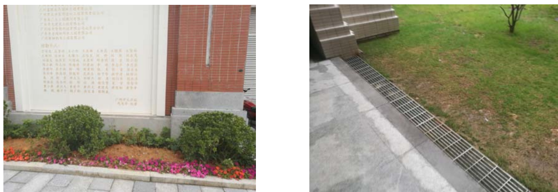
图 4-2 水土保持植物措施现状

经对比，本项目实际实施的水土保持植物措施量较方案阶段设计与项目主体工程同期建成，水土流失情况得到有效控制；此外，施工期间根据实际情况项目建设区内园林绿化措施稍有增加。