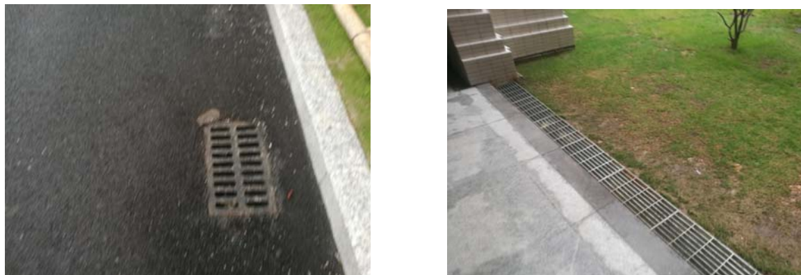
图 4-1 水土保持工程措施现状

经对比，本项目实施的水土保持工程措施量较方案阶段设计有所增加，满足场地排水要求。