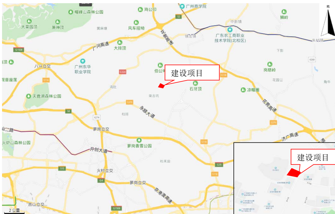
图 1-1 项目地理位置