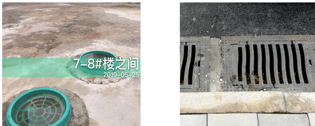
图4.1-1 水土保持工程措施现状

通过对比，实际实施的排水管网较方案阶段增加了2381.9m，主要原因为方案阶段主体仅对项目内部排水管网进行设计，实际施工过程中新增了项目东、西两侧代征道路用地区域的排水管网建设。现场可见，项目排水管网已建设完成，满足场地排水要求。