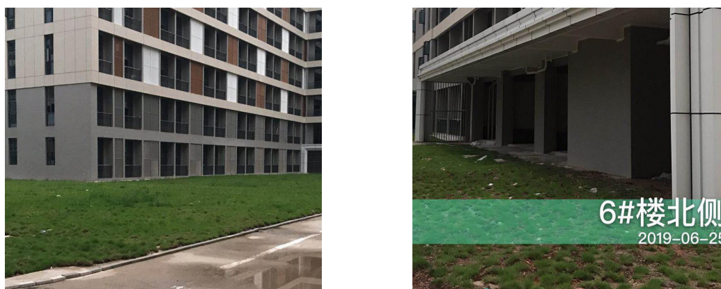
图4.2-1 水土保持植物措施现状

通过对比，主体工程区实际完成的水土保持植物措施量较方案计列的园林绿化面积减少了0.03hm 2 ，主要原因是建设单位调整了项目园林绿化的布局，减少的绿化面积已于项目1#、2#楼建设后期布设；施工临建区实际完成的水土保持植物措施量与方案计列基本一致。项目建设区内植物措施实施基本到位。