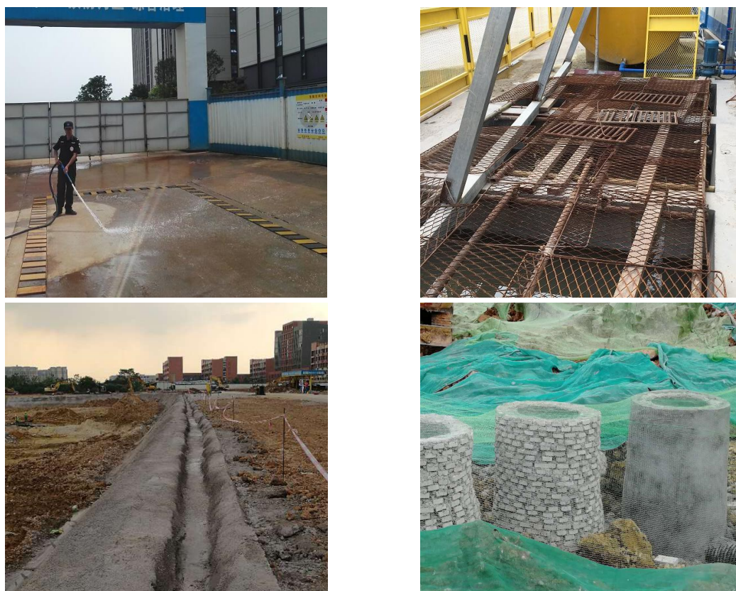
图4.3-1 水土保持临时措施

通过比较实际完成的水土保持临时措施量和方案计列的措施量,本次验收范围实际实施的临时措施基本一致,基本上可以满足水土保持防护要求。